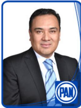
Dip. Ulises Ramírez Núñez.

Toluca, Capital del Estado de México, Diciembre 12 de 2012