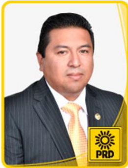
Dip. Epifanio López Garnica.

Toluca, Méx., a 06 de diciembre de 2012.